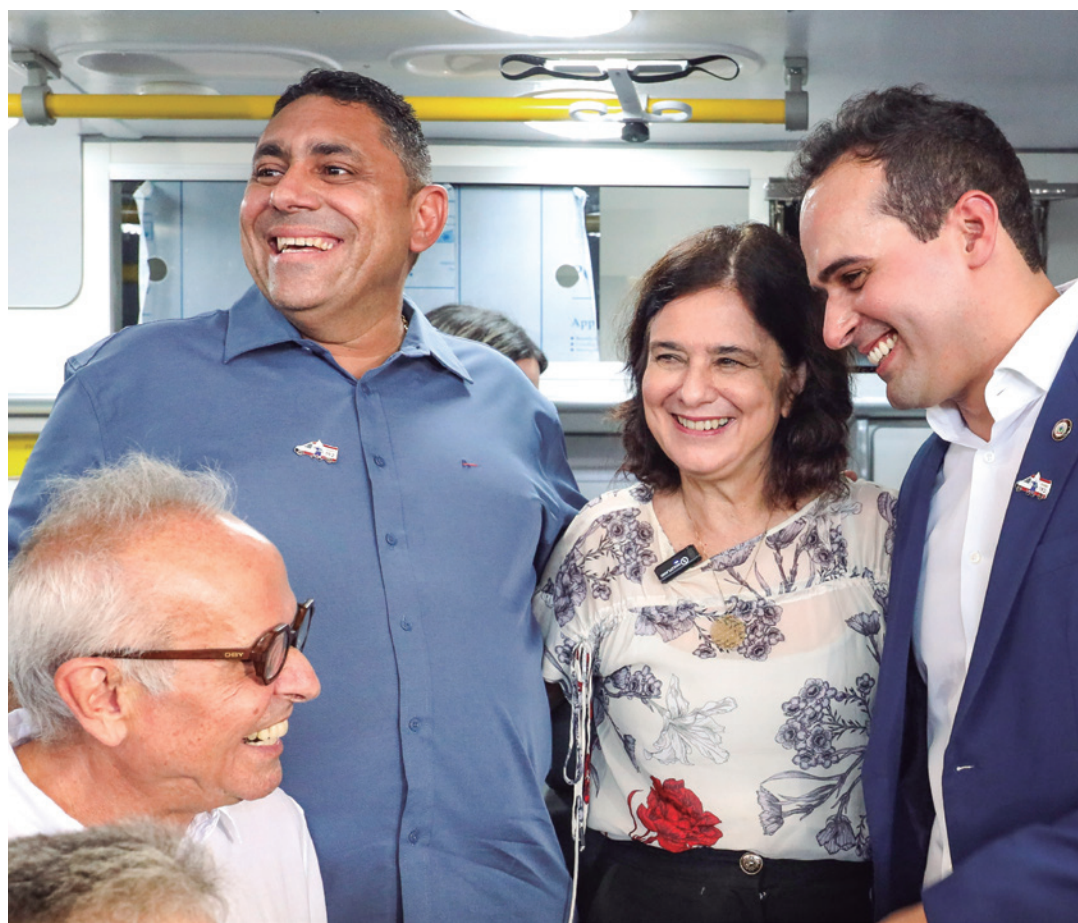
Lucas Ribeiro recebeu a ministra Nísia Trindade, com o prefeito da capital Cícero Lucena

O prefeito Cícero Lucena ressaltou ainda a importância dos municípios na oferta de serviços à população, em especial na área da saúde. O gestor defendeu a união entre os poderes municipal, estadual e federal para o avanço e conquistas em benefício da população.