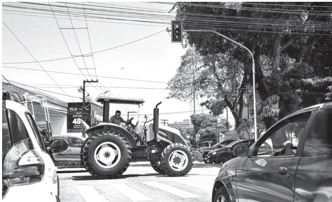
Peso pesado no trânsito