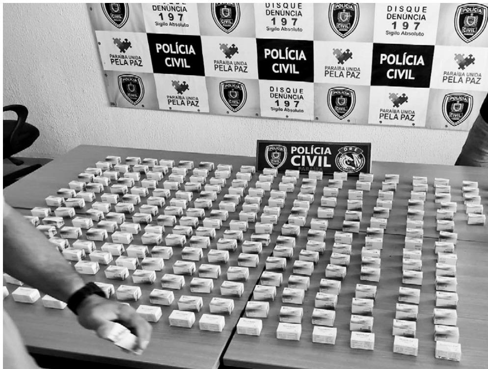
Foram apreendidas 300 caixas de anabolizantes que estão avaliadas em R$ 100 mil