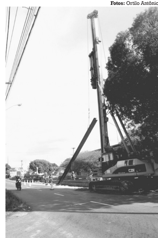
Trabalhadores iniciaram a fundação das estacas metálicas, cada uma com, aproximadamente, 25 metros de profundidade

■ Equipamento construído pelo DER-PB terá 300 metros de extensão. Prazo de entrega é de, no mínimo, um ano