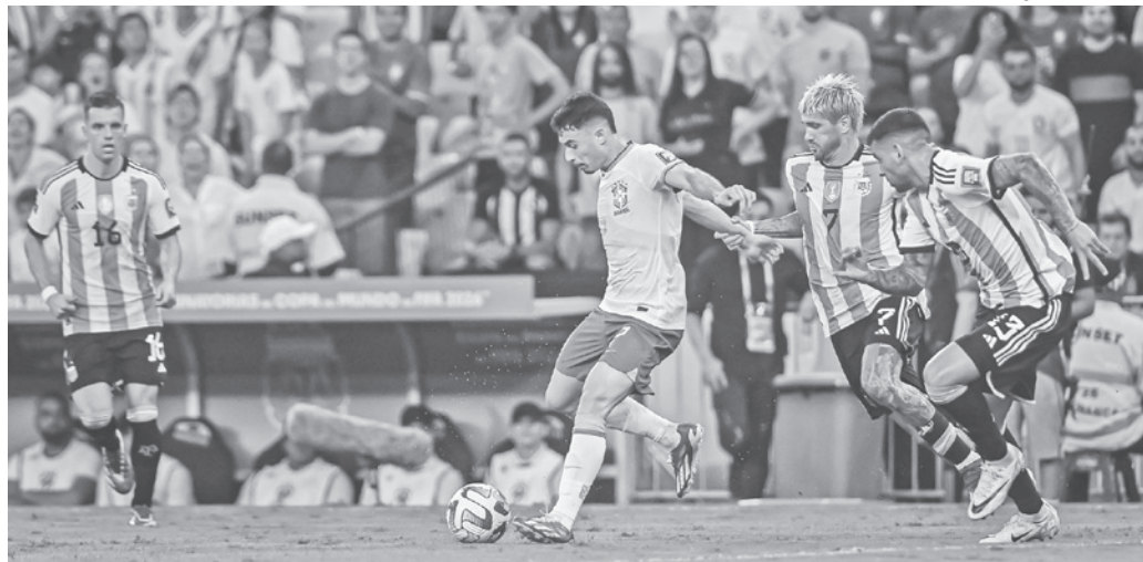
Brasil e Argentina no Maracanã, mas o futebol perdeu para a pancadaria na arquibancada