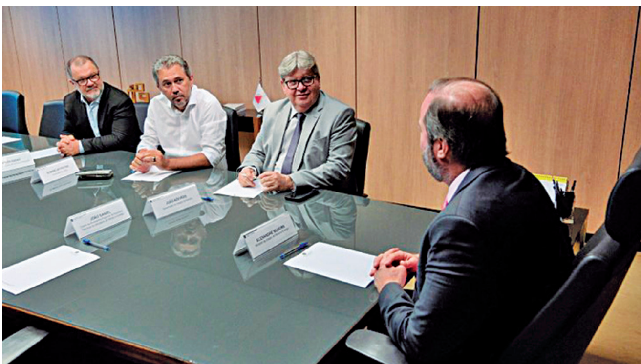
João Azevêdo debate a prorrogação das outorgas para as empresas que atuam no segmento das energias renováveis

“Agora vou fazer o chamamento desses seis, porque o terreno é nosso, da prefeitura, e as empresas vão apresentar os projetos. Em relação aos empreendimentos aprovados em parceria com a iniciativa privada, a gente ainda vai discutir de que forma será feita a contrapartida”, explicou a secretária.