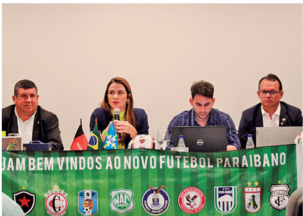
Conselho Técnico define que a fórmula da disputa segue a mesma edição de 2023