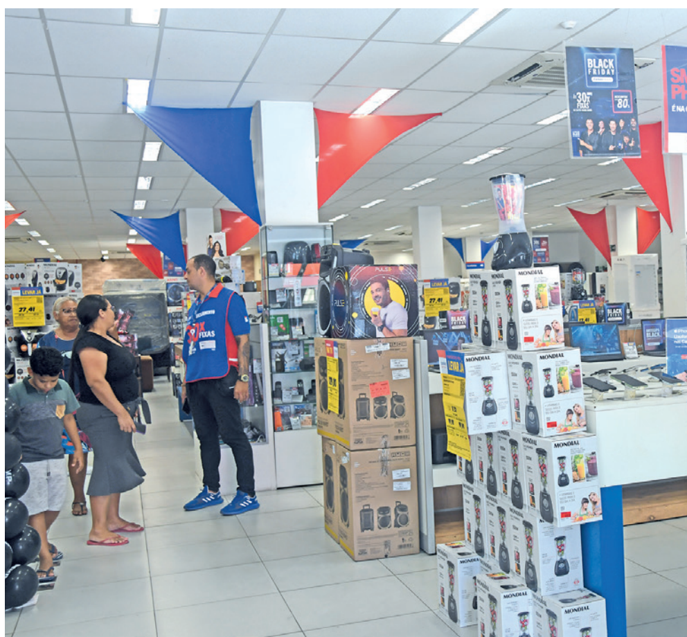
Estabelecimentos comemoram alta de até 20% nas vendas antes mesmo do dia promocional