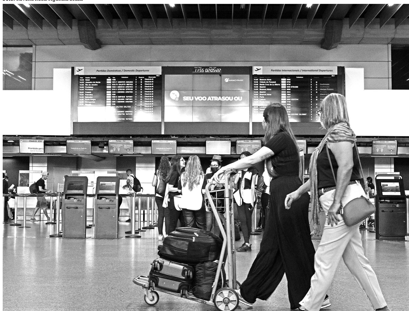
No mês passado, foram transportados cerca de oito milhões de passageiros em voos dentro do Brasil, segundo a Anac