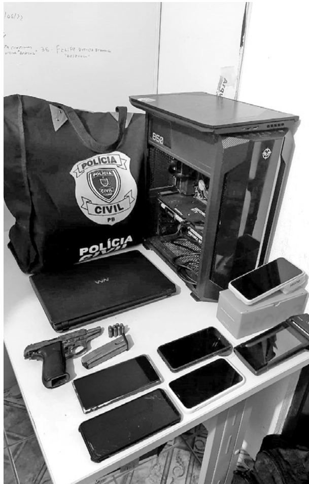
Celulares e uma arma foram apreendidos pela PC